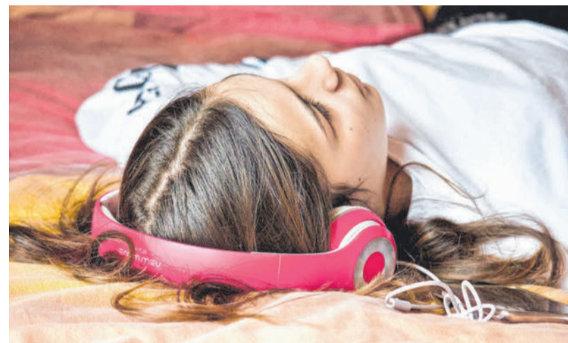
Ausklinken aus dem Alltag der Erwachsenen ist bei Jugendlichen in der Pubertät an der Tagesordnung. Es sollte Eltern nicht ständig irritieren.

Handy und Computer komme in Zeiten von Corona besondere Bedeutung zu, sagt die Expertin und Mutter von zwei pubertierenden Töchtern. „So, wie wir Erwachsene unsere Meetings in virtuelle Besprechungsräume verlegen mussten, so können sich die Jugendlichen in ihren digitalen Sozialräumen treffen.“ Eltern biete sich dadurch die Chance, einen Teil der Lebenswelt ihrer Kinder kennenzulernen, der sonst verschlossen bleibe. „Was Jugendliche zu jeder Zeit brauchen sind Rückzugsräume, mit oder ohne Corona“, sagt die Gesundheitspsychologin. „Ob echt oder durch Medien erschaffen, immer bieten diese Freiräume die Möglichkeit, dort