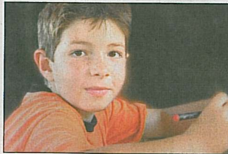
Für vier Kinder konnten passende Familien gefunden werden, doch es braucht mehr.