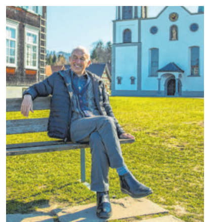
Der Pfarrer genießt die terminfreie Zeit, betet jetzt aber noch mehr für andere.

Leben über Nacht verändert. „Ich habe 22 Jahre lang Tag und Nacht gearbeitet. Plötzlich hatte ich kaum noch Arbeit. Es war eine Reduktion von 180 auf quasi null Prozent.“ Das ist neu für ihn, dass er Zeit zum Nachdenken hat. Seine Einstellung zur Arbeit ist jetzt eine andere. „Ich werde kürzertreten und mir selbst mehr Zeit gönnen“. Der 54-Jährige hofft, dass er gesund bleibt und seinen Traum noch verwirklichen kann. „Ich möchte eine Familie gründen und in der Basilika heiraten.“