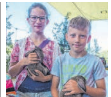
Tierfreunde kamen am Wochenende voll auf ihre Kosten.