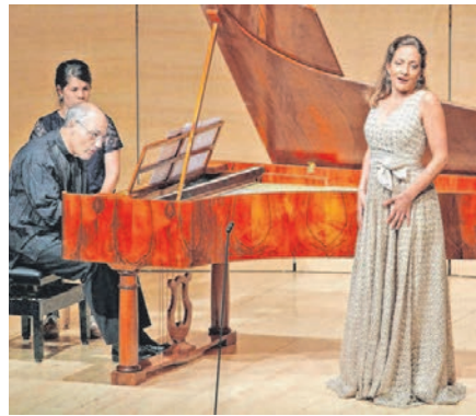
Perfekter Schubertiade-Auftakt Klassik-Stars in Schwarzenberg /D4

Handballer lösen EM-Ticket Nach dem Heim-sieg über Bosnien sind Robert Weber und Co. bei der EM 2018 in Kroatien dabei /A1