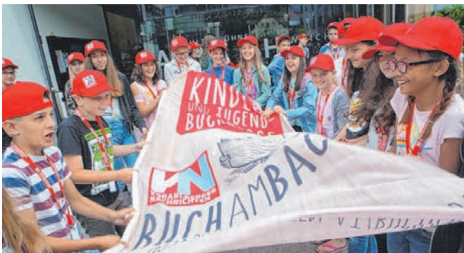
Die hilfsbereiten Buchguides sind gut vorbereitet für die 6. Auflage der „Buch am Bach“ in Götzis.

Größte Kinder- und Jugendbuchmesse Vorarlbergs, die VN-„Buch am Bach“, startet morgen, Dienstag, in Götzis.